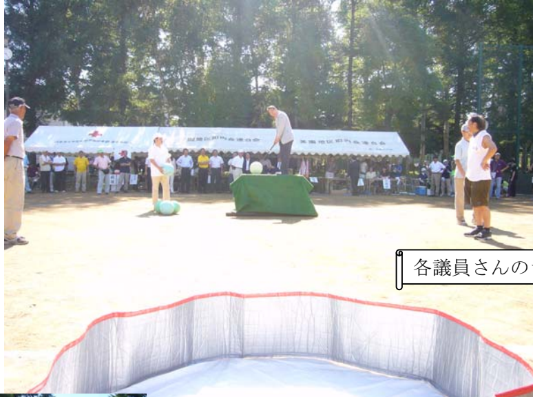
各議員さんのショットです