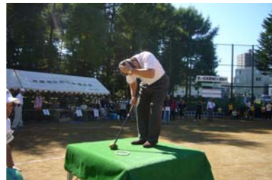
豊平区職員のショットです