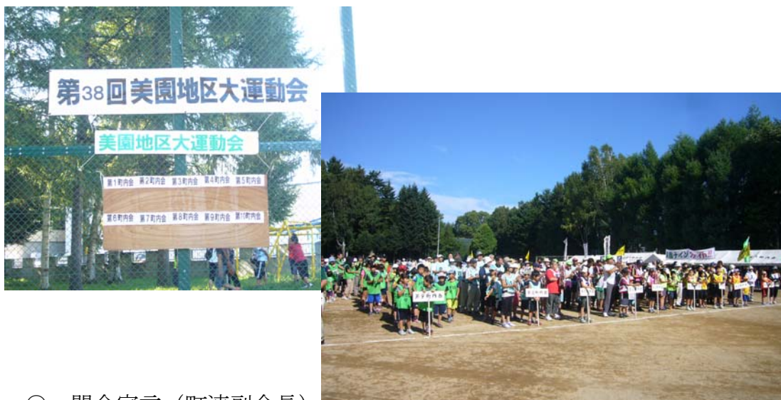
○ 開会宣言 (町連副会長)

秋晴れの絶好の運動会日和の中、地域の多くの人達の参加により、美園地区大運動会が開催されました。昨年は台風の影響で、初めて中止となりましたが、そのうっぶんを晴らすかのような、素晴らしい盛り上がりの大会となりました。