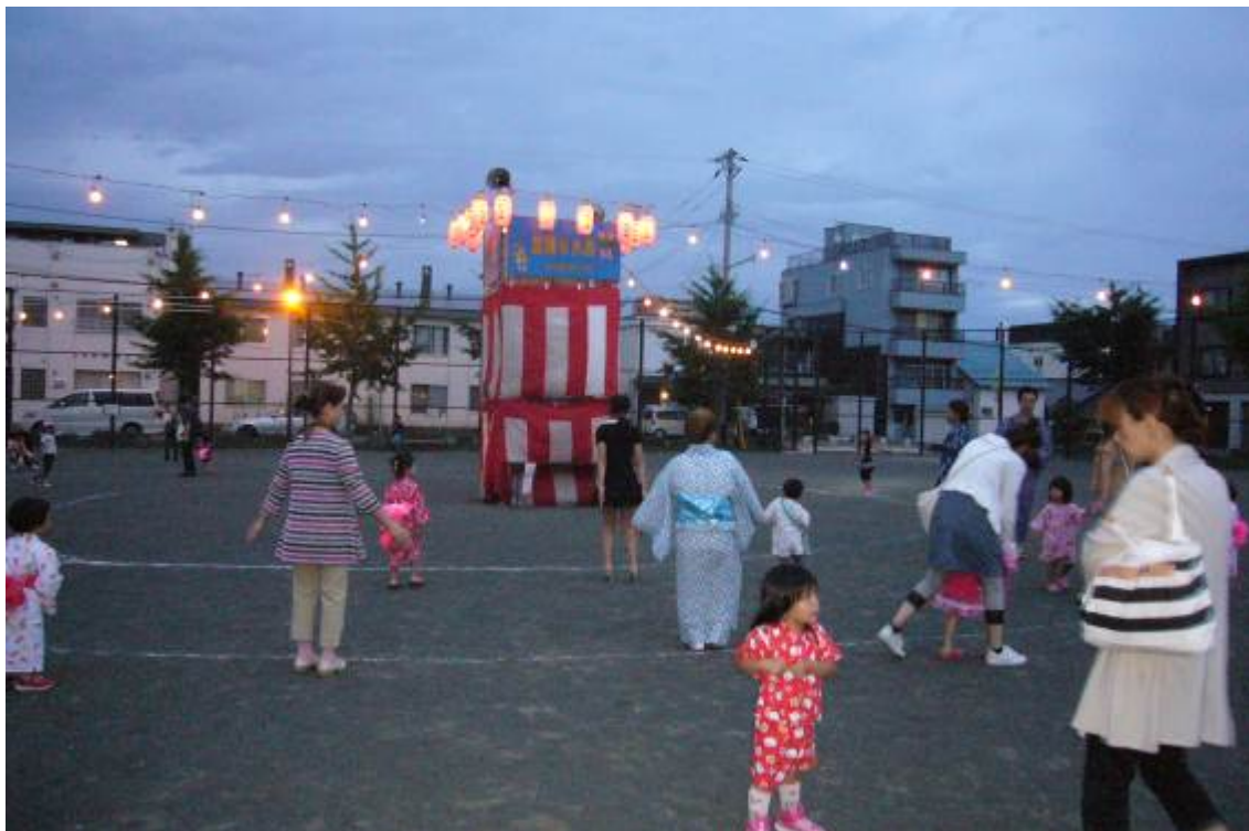
○ 第3町内会 盆踊り (8/4 美園さかえ公園)