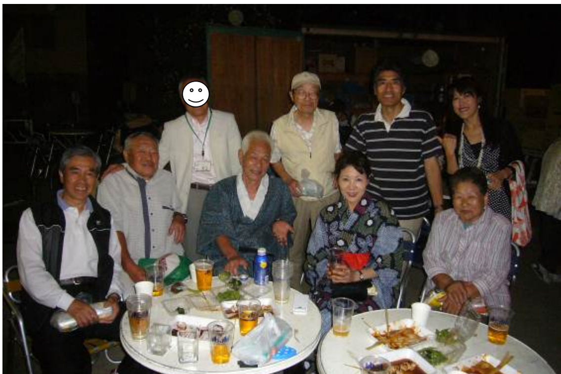
○ 第9町内会 夏まつり盆踊り (8/14 月寒公園坂下グラウンド)