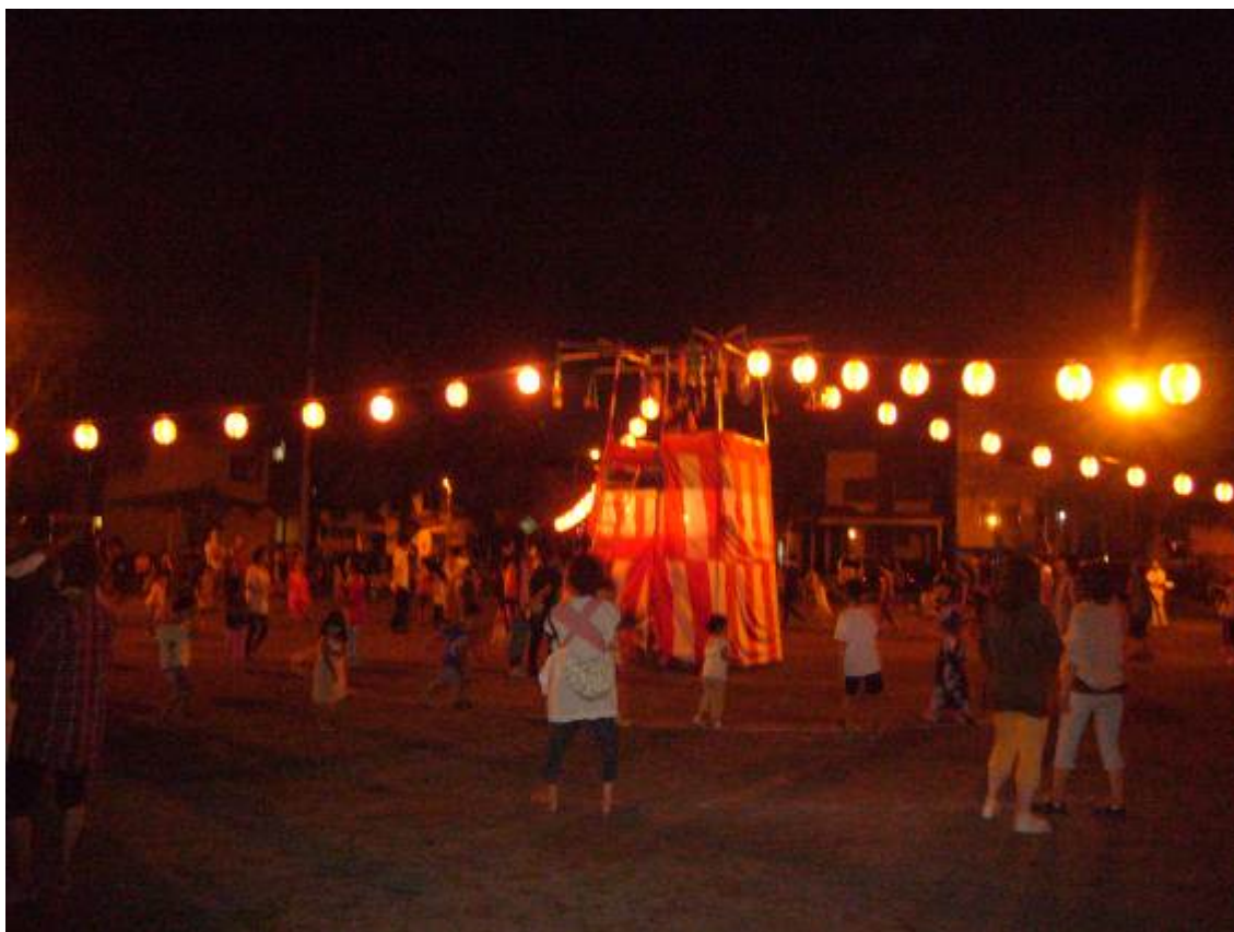
○ 第8町内会 盆踊り (8/15 みすみ公園)