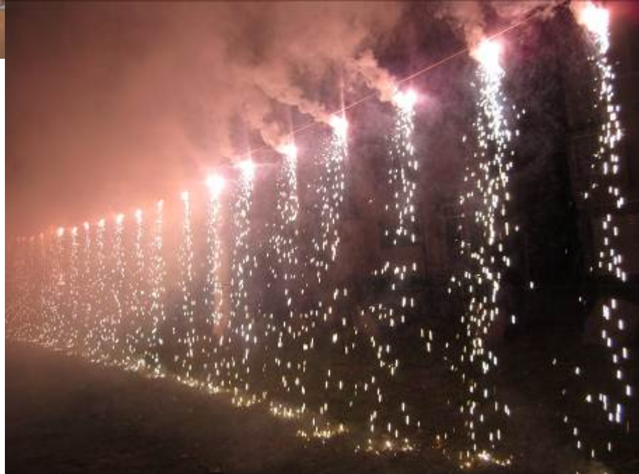
ナイアガラ 綺麗ですね！