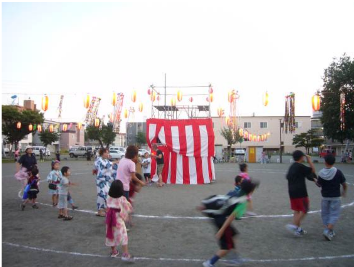
○ 第4町内会 子供盆踊り (8/14 美園しらかば公園)