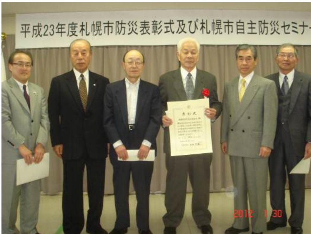
自主防災セミナー