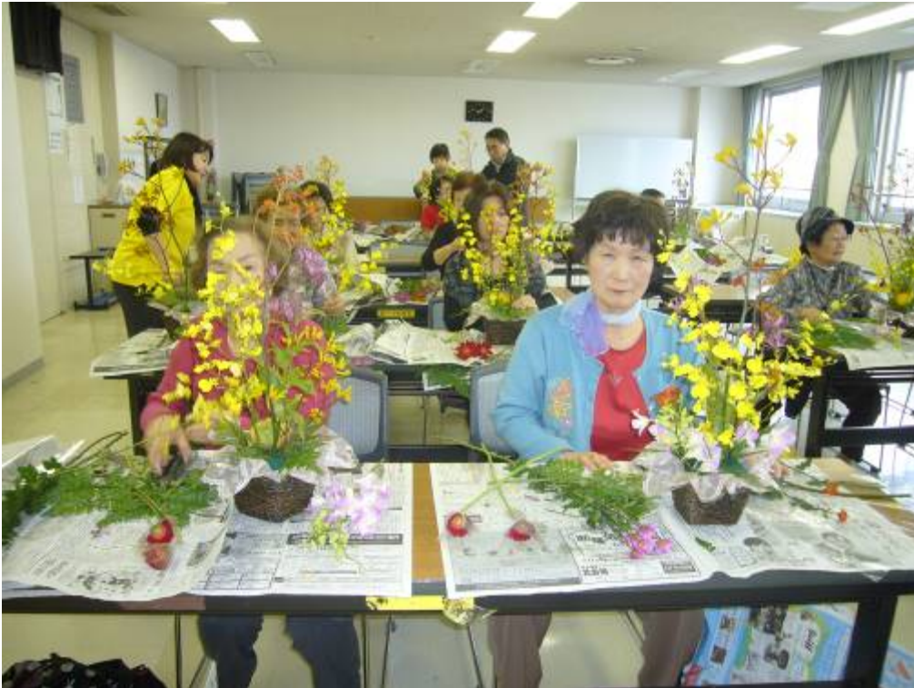
体験・遊びのコーナー 子育てサロン