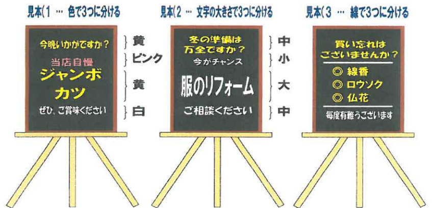
(手風琴 さんの作品)