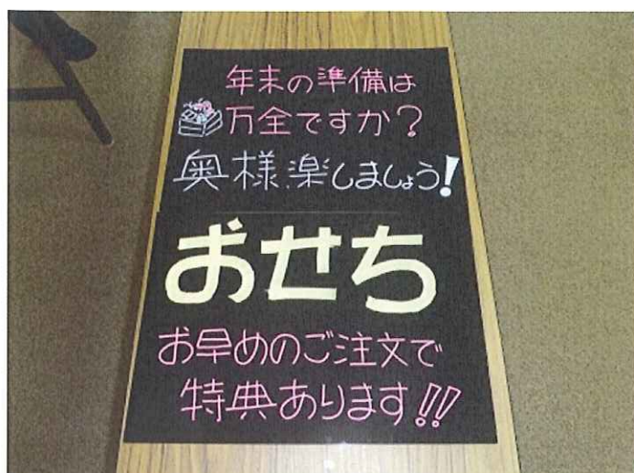
(商店街・事務局 さんの作品)